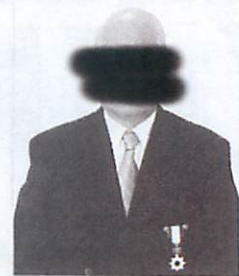
〇〇氏(〇〇歳) 元 〇〇県組合副理事長

おおくの生同組合員が、将来の叙勲に憧れ、行政や業界団体に隷従する。叙勲が業界を悪化させている。