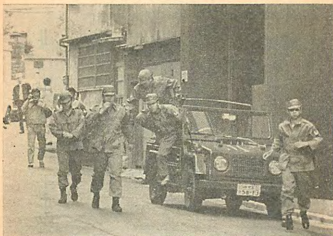
カンボジアに侵入した南ベトナム軍ではありません。5月27日、報知新聞社にかけつけた右翼暴力団の一部です。

「……みんなが、この私のことを信頼して、 待っていてくれたと思うと、申しわけなくて……」