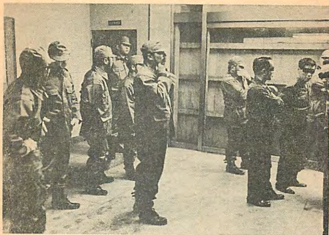
暴力団に占領され、板べいを打ちつけられた玄関