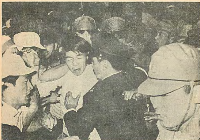
ひどい暴力、この組合員は鼻柱にヒビが入った

の対立感情こそ、資本家の喜んできた、職場支配の中味だったのだ。今、その体制が音を立てて崩れつつある。岡本「弁務官」による、血も涙もない無法植民地政治に対して、全植民地住民が声をあげはじめたのだ。国家権力と財界の援助をうけた読売資本と報知経営者の攻撃は決して、甘いものではない。個人も組織も血のふきでるたたかいの毎日が続くだろう。だが、たたかうすべての報知労働者にとって、五月二日の団結集会は、長く苦しい人間復帰のたたかいの幕明けとして、永久に胸にきざみこまれるに違いない。