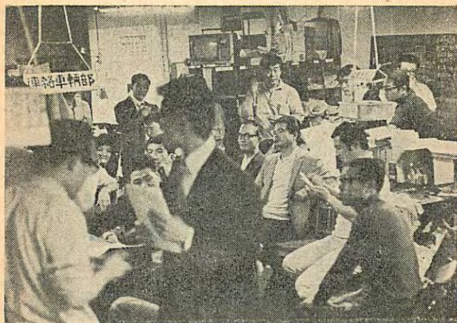
連絡所はまるで編集局，明るい顔がならぶ

「似てるけど、これはかの有名なる報知占領中の右翼暴力団の姿……おまわりさん、知ってるだろう。ホント悪い奴なんだよ……」 おまわりはニガ虫をかみつぶしたような顔でいった。