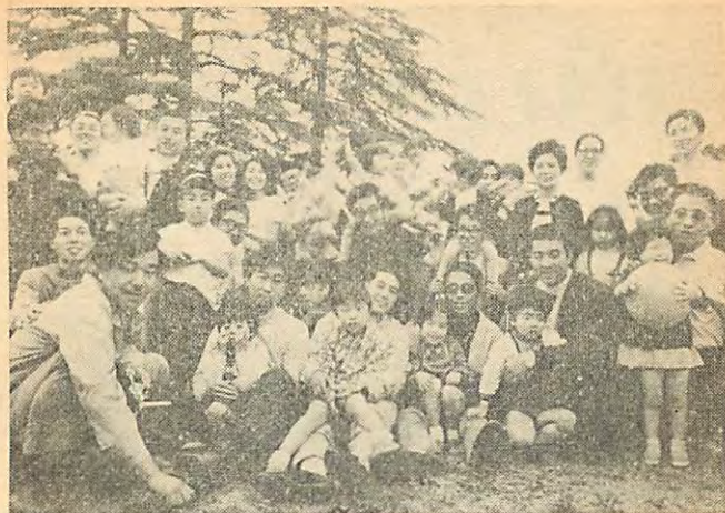
ロックアウト後も明るい写真部の家族交流